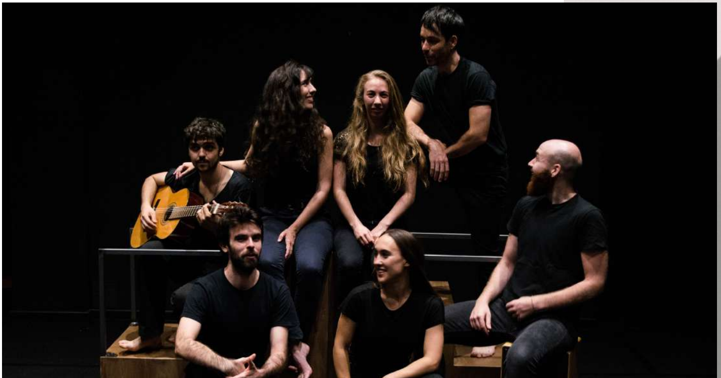
dir: Alejandro Pollán dén: Alfonso López